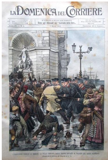
Fotografija 2: Naslovnica italijanskega časnika La Domenica del Corriere, 3. marec 1902, privatna kolekcija