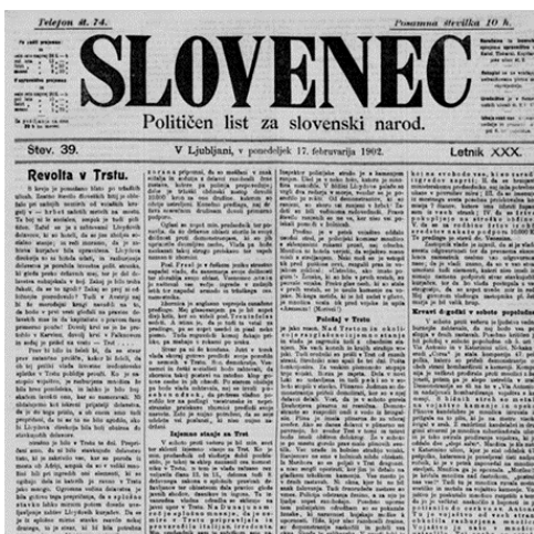
Fotografija 4: Naslovnica slovenskega časnika Slovenec, 17. februar 1902, Dlib