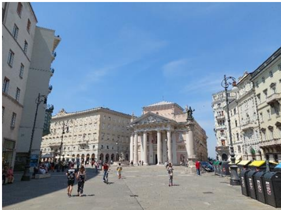
Fotografija 1: Pogled na Borzni trg (maj 2023)

Tržaška generalna stavka predstavlja enega izmed odločilnih trenutkov v zgodovini delavskega gibanja v Avstro-Ogrski in na Slovenskem na sploh. Šlo je za enega izmed redkih tovrstnih izrazov javnega mnenja, ki je na začetku tako v solidarnosti povezala vse politične struje slovenske politike. Slovensko ozemlje še do velike tekstilne stavke leta 1936 ni doživelo tako množičnih demonstracij. Tudi danes je v Trstu še moč najti spominske plakete in spomenike, ki obujajo demonin na revolucionarne februarske dni leta 1902.