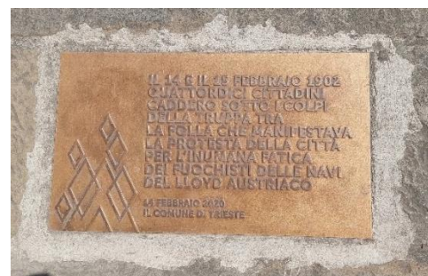
Fotografija 3: Spominska plošča padlim med streljanjem na Borznem trgu, maj 2023