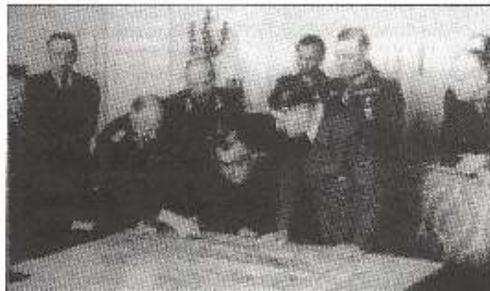
V Salzburgu se ni samo rokovalo. Hitler in njegovi generali so seznanili slovaškega predsednika Tiso z vojnimi razmerami in načrti za vojno premike po padcu Francije.

K izrazitemu vplivu nacistov na slovaško gospodarstvo je pomagalo tudi ohlikovanje meddržavnih pogodb z Nemčijo, katere so bile za Slovaško večinoma neugodne. Že v juniju 1939 je bila med obema državama podpisan uradni trgovinski sporazum. Le-ta naj bi bil sicer zgrajen na principu enakopravne porabe, toda prvenstveno je šel za glavni interesi Nemčije. Medtem, ko je Slovaška anglašala z znižanjem carin za 143 nemških proizvodov, je na drugi strani zase dobila znižanje samo za majhno število slovaških proizvodov (npr. za ovčji sir, kumare, zobne ščetke in pohištvo). Zelo neugoden je bil tudi tečaj