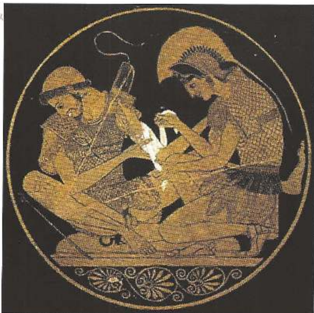
Zgolj delnost do sovojaka ali ljubezen na fronti? (Ah! obvezuje Patrokla)

letom 1920. Le-li so ugotovili, da gre tu nesporno za hudo duševno motnjo, in kot tako jo je treba čimprej začeti zdraviti. S tem so homoseksualce prenehali pojmovati kot kriminalce, ter jih namesto v zapore začeli trpeti v psihiatrične ustanove. Potem je prišel Sigmund Freud (ter razvil teorijo Ojdipovega sindroma. Ugotovil je, da je do tovrstnih