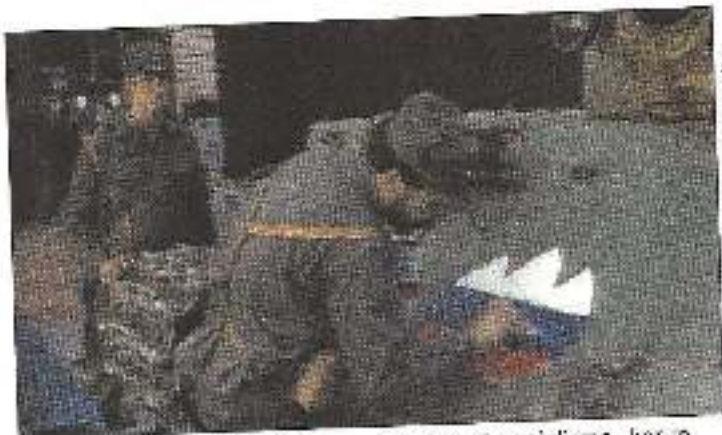
Info: www.vojna.si, fotografija: Peter Torker

Še preden se lotim pregleda razvoja teritorialne obrambe v Sloveniji je treba opredeliti besedni zvezi »teritorialna obramba« in »teritorialne obrambe«. V prvem primeru gre za teritori-