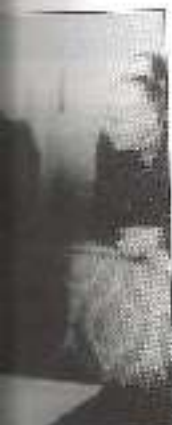
Generali so morali in načrti za

visko komisije gospodarstvom, se vedno ni z omejitvi suverene države. Do drugega kroga gospodarnosti nacistov, je leta 1944. Med pomembnejšimi sprejetimi pogodbenimi vojske, s Nemčijo odprtemu slovaškega